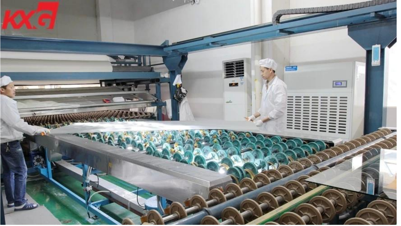
انخفاض الحديد مغلقة خفف من الزجاج التعبئة 21.52