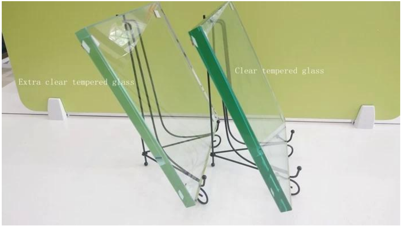
إضافي واضح مزاج زجاج التعبئة 6 mm