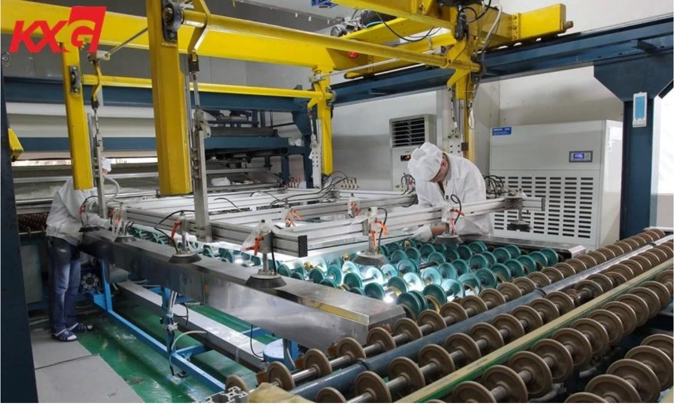
ناي الأوتوكلاف 8 ساعات 3mm الثلاثي خفف من الزجاج 12 + 12 + 12 KXG