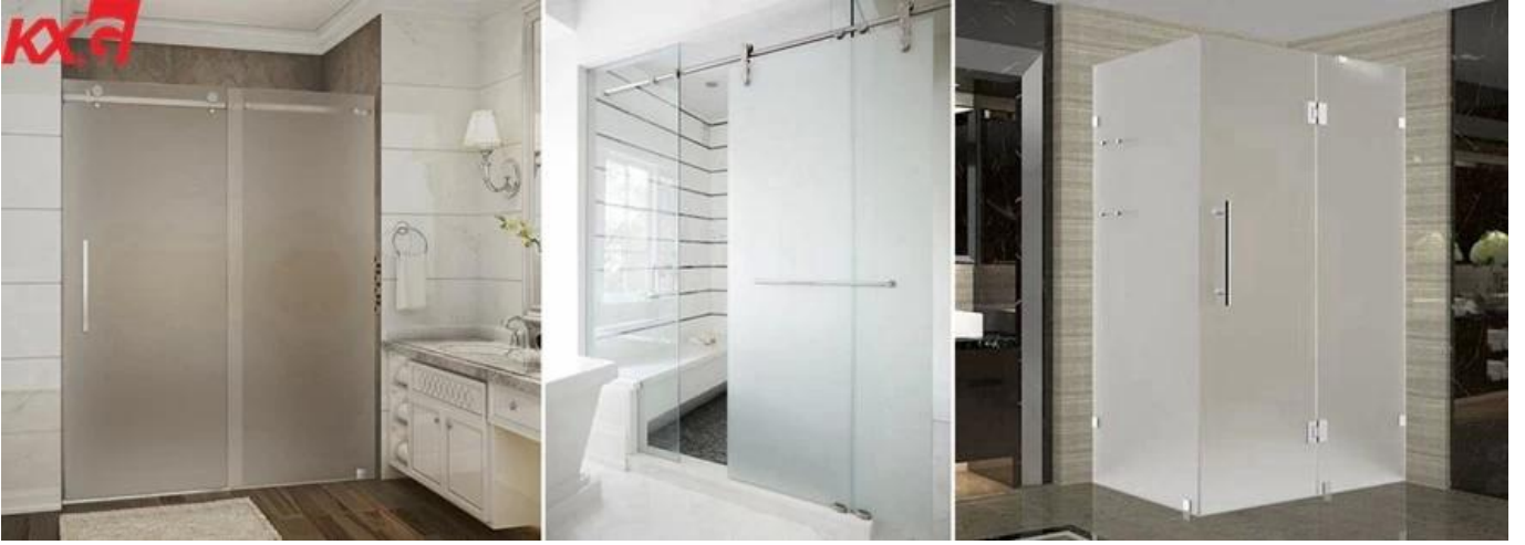
متجمد ورشة عمل مغلقة الزجاج المقسى KXG