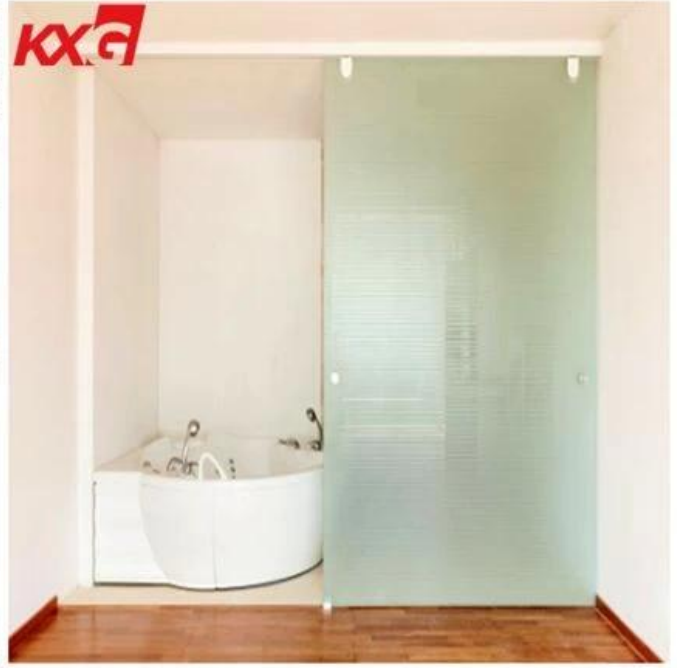
KXG قفص صفة في Pywood قوي