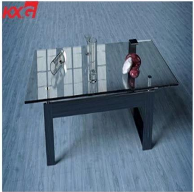
Mesa Parte superior Vaso Embalaje en KXG