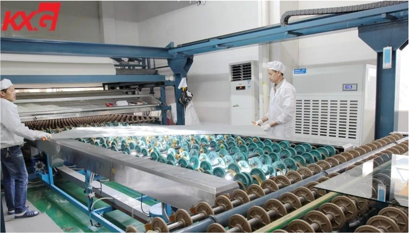
21.52 pembungkusan kaca berlamina besi rendah