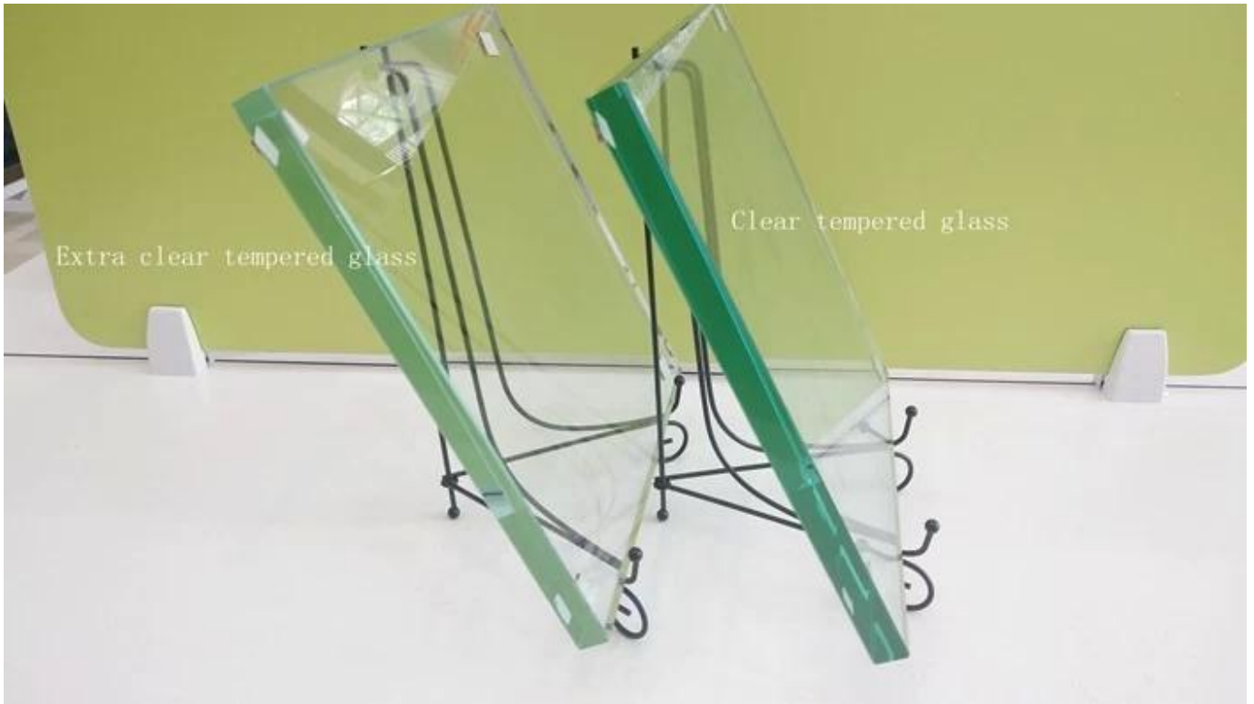
6 mm Tambahan jelas merah kaca pembungkusan