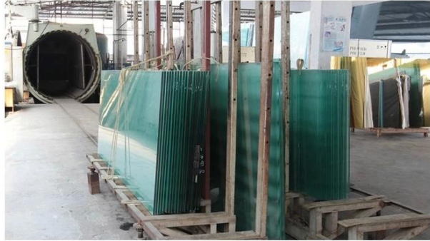
Pembungkusan untuk panel kaca bingkai 13.52mm Clear Laminated