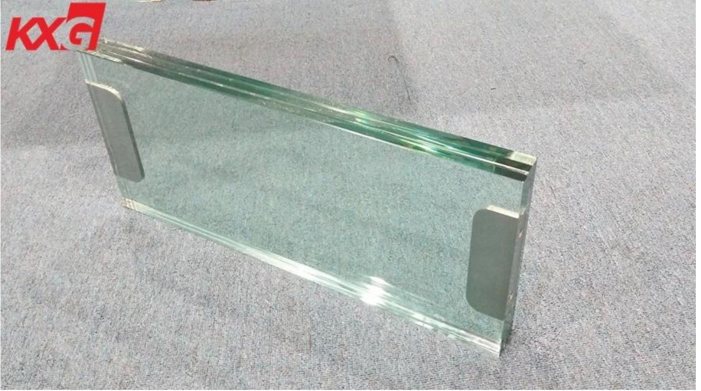
Bengkel kaca berlapis SGP di Kilang Kaca Kunxing