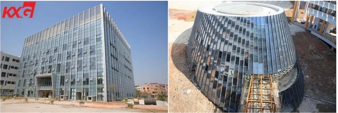
KXG DGU keselamatan kawalan solar tergendala kaca terlindung pembungkusan