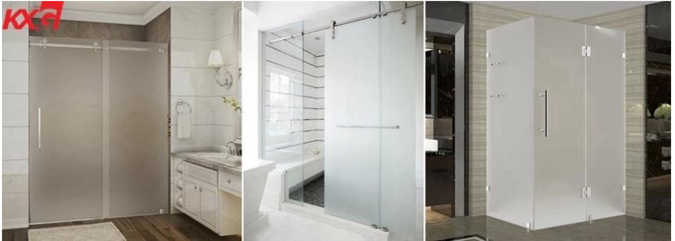
Bengkel kaca laminated KXG frosted