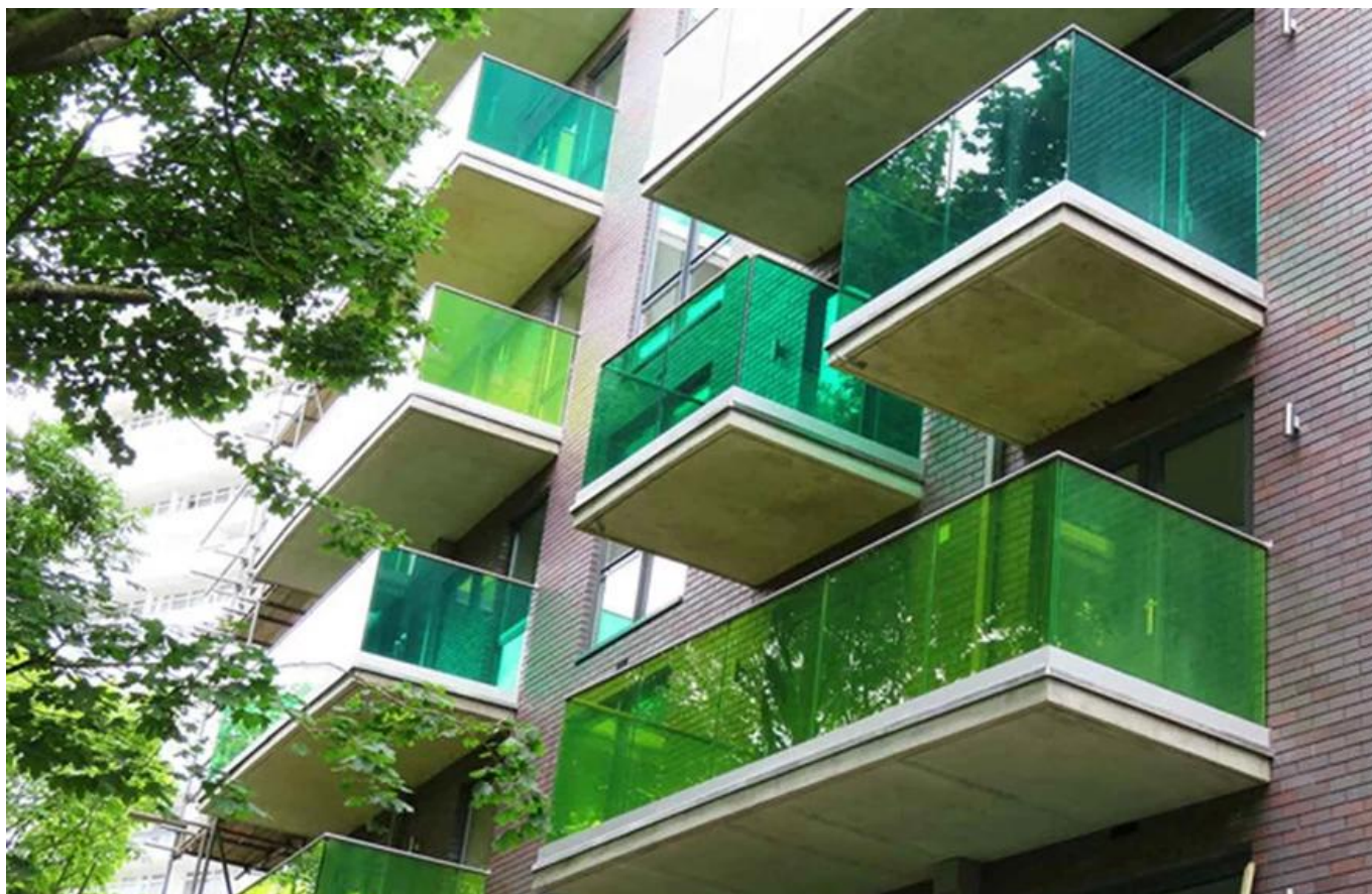
Filem PVB berwarna bertekanan projek kaca laminasi