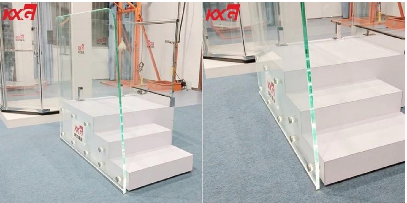
19 mm Ultra malinaw na tempered glass production line