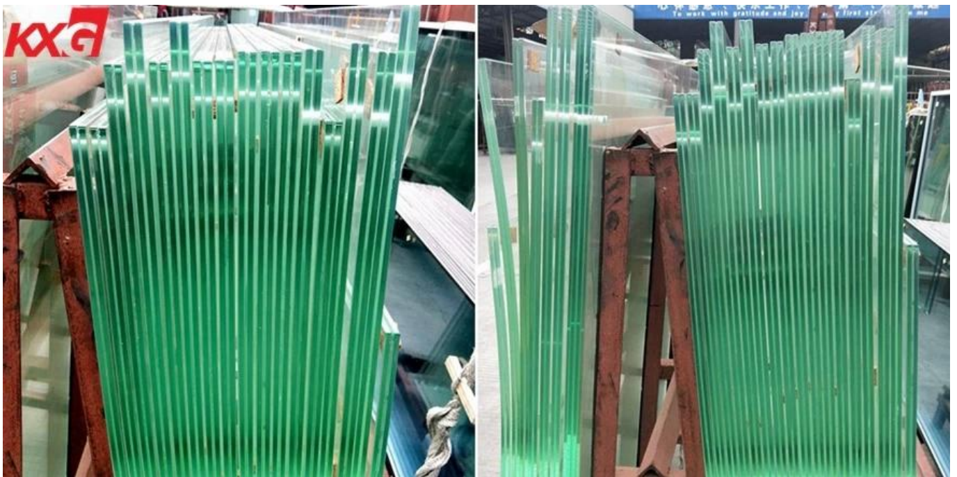
Tempered glass, Tempered laminated glass at HST tempered laminated glass