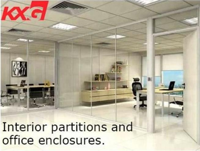
Interior partitions and office enclosures.