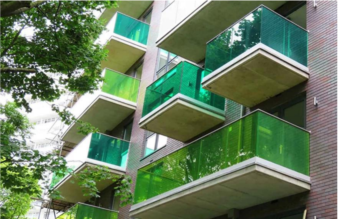
Ang may-kulay na PVB na film na toughened laminated glass project