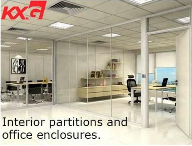
Interior partitions and office enclosures.