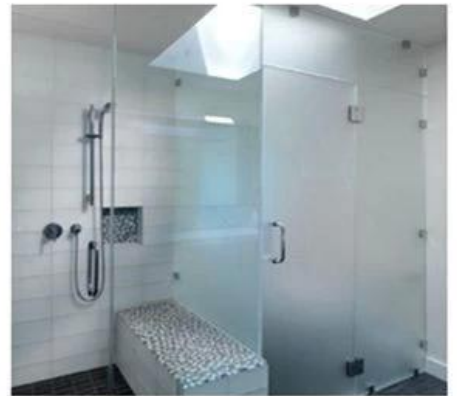
KUNXING Glass PANDEZO YA STANDARD