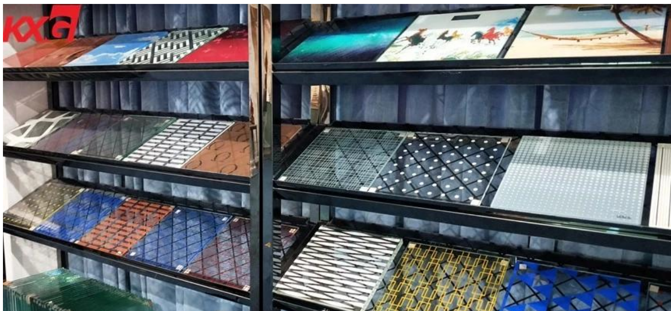
8 mm 10 mm uchapishaji wa kioo cha kioo cha kioo