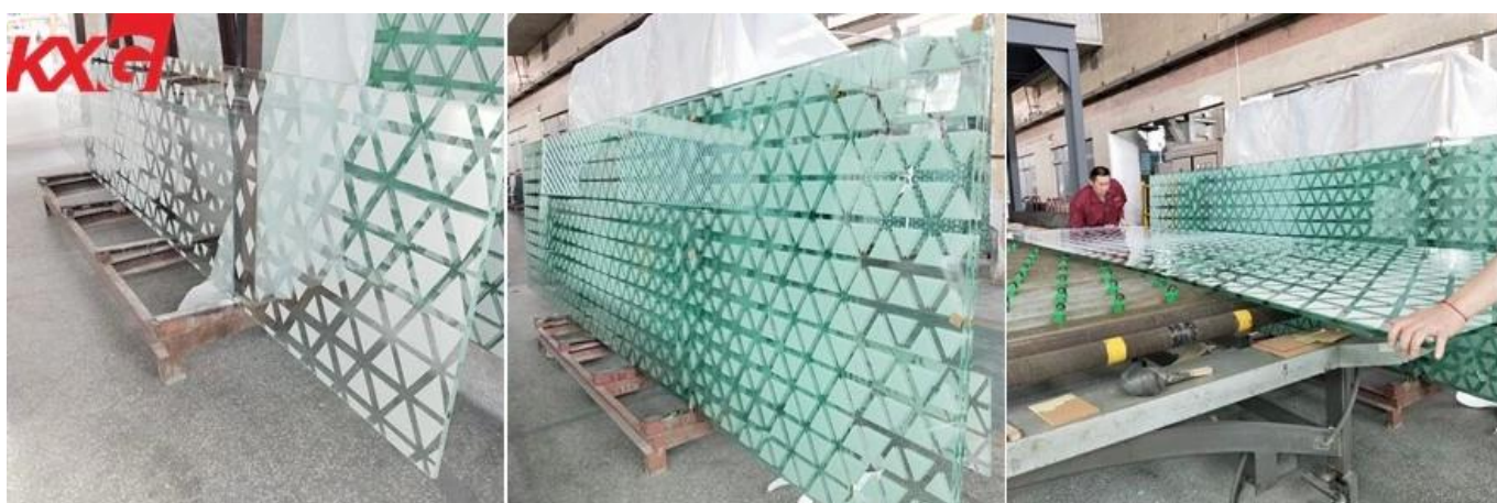
KXG 8 mm 10 mm uchapishaji wa silkscreen uliojaa kioo