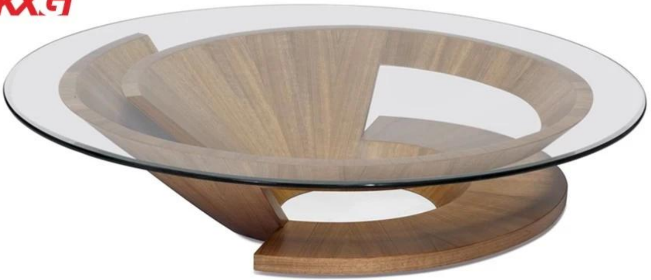
KXG 12mm rõ ràng kính cường lực hàng đầu kính cường lực Trang thiết bị